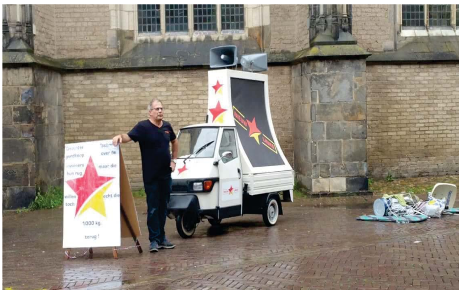
De NIEUW-LINKS actie op het Grote Kerkhof tijdens de voorjaarsnota

NIEUW-LINKS heeft veel gesprekken met inwoners van Deventer gevoerd. 75% van de mensen geeft aan dat zij heel voorzichtig zijn met het wegbrengen van (grof) afval. Ook zegt men dat zij het problematisch vinden dat huisvuil niet zomaar meer aan de weg kan worden gezet. Mensen irriteren zich aan het feit dat men nog maar 100 kg per jaar kan storten tenslotte is de 100 kg met een kast en bankstel zo bereikt. NIEUW-LINKS eist dat we weer terug gaan naar 1000 kg vrij storten! Hierdoor zal de prikkel afnemen om illegaal te dumpen. Ook willen we dat maandelijks de ouderwetse 'kraakwagen' weer door de straten rijdt.